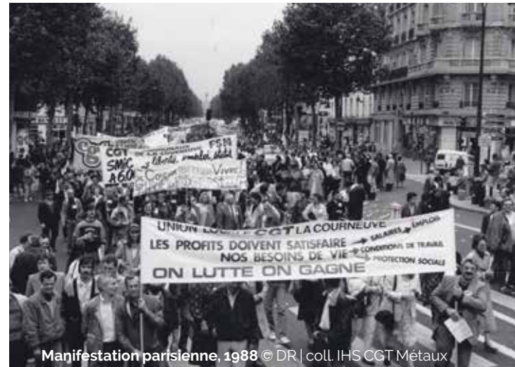
Manifester parisienne, 1988

La CGT s'engage, non sans débats, dans d'importantes évolutions internes, avec l'abandon dans ses statuts de la référence à l'abolition du salariat, l'encaissement puis la ventilation des cotisations syndicales par la confédération ou encore le départ de la Fédération syndicale mondiale (FSM) et l'adhésion à la Confédération européenne des syndicats (CES), puis à la Confédération syndicale internationale (CSI).